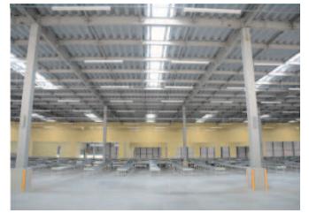
ベシア様千葉流通センター内