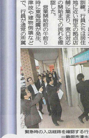
緊急時の入店経路を確認する行員 一静岡市清水区の清水銀行草薙支店

災害時は緊急参集店舗へ 清水銀行は14、18日、営業時間外の大規模災害を想定した初のBCP(事業継続計画)訓練を「緊急時参集店舗」に指定した真内35の営業店で実施した。